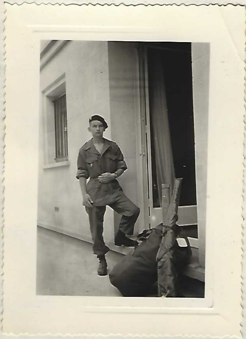
F.3 Le jour du départ