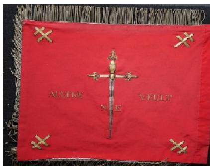
Devise 1er RHP - AULTRE NE VEULT