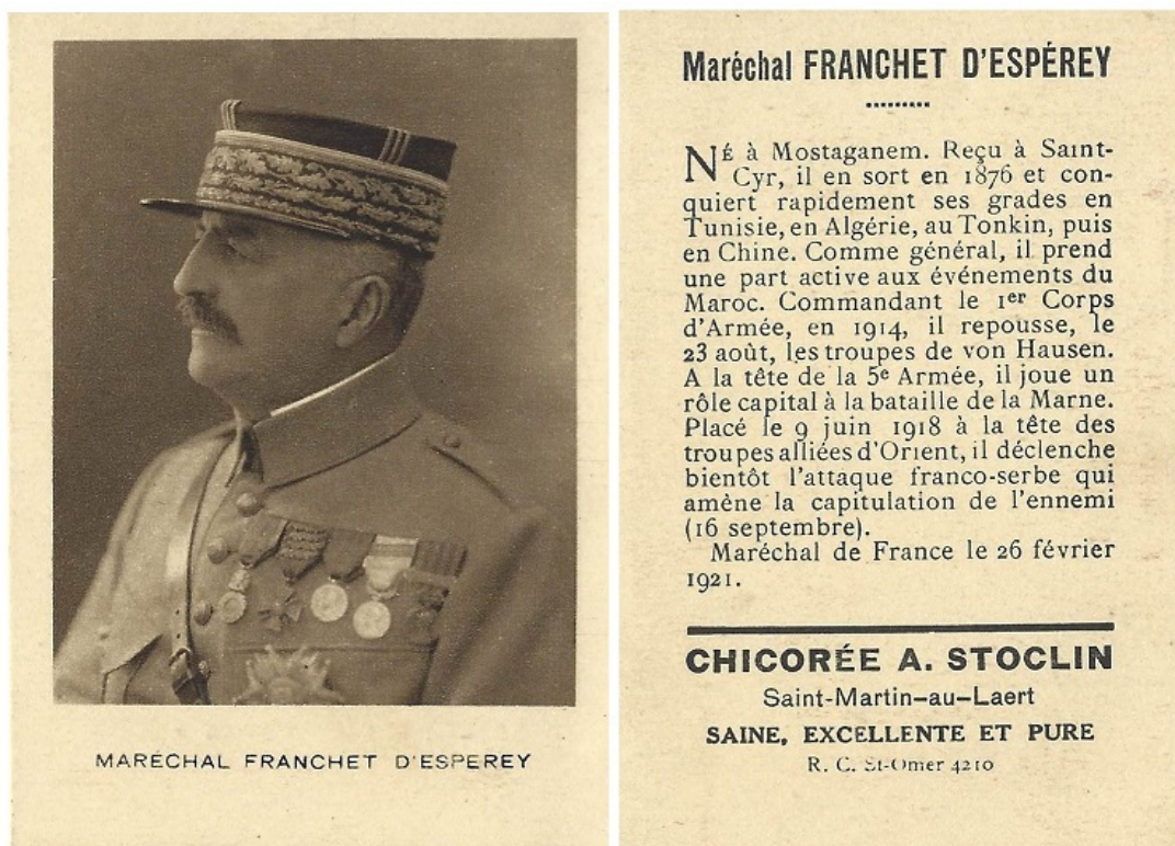
Louis Franchet d'Espèrey