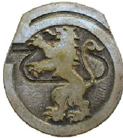
Insigne 5e Régiment de Chasseurs d'Afrique